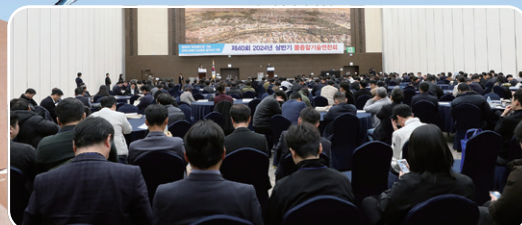
2024년 2월 9일 경주 HICO에서 개최된 「제40회 2024년 상반기 물종합기술연찬회」 모습.

주 최 국회환경포럼·「위터저널」·한국환경기술연합회·경상북도·경주시·한국초순수담수화학학회·한국지하수지열협회