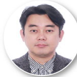
이동성 팀장 (코오롱글로벌)